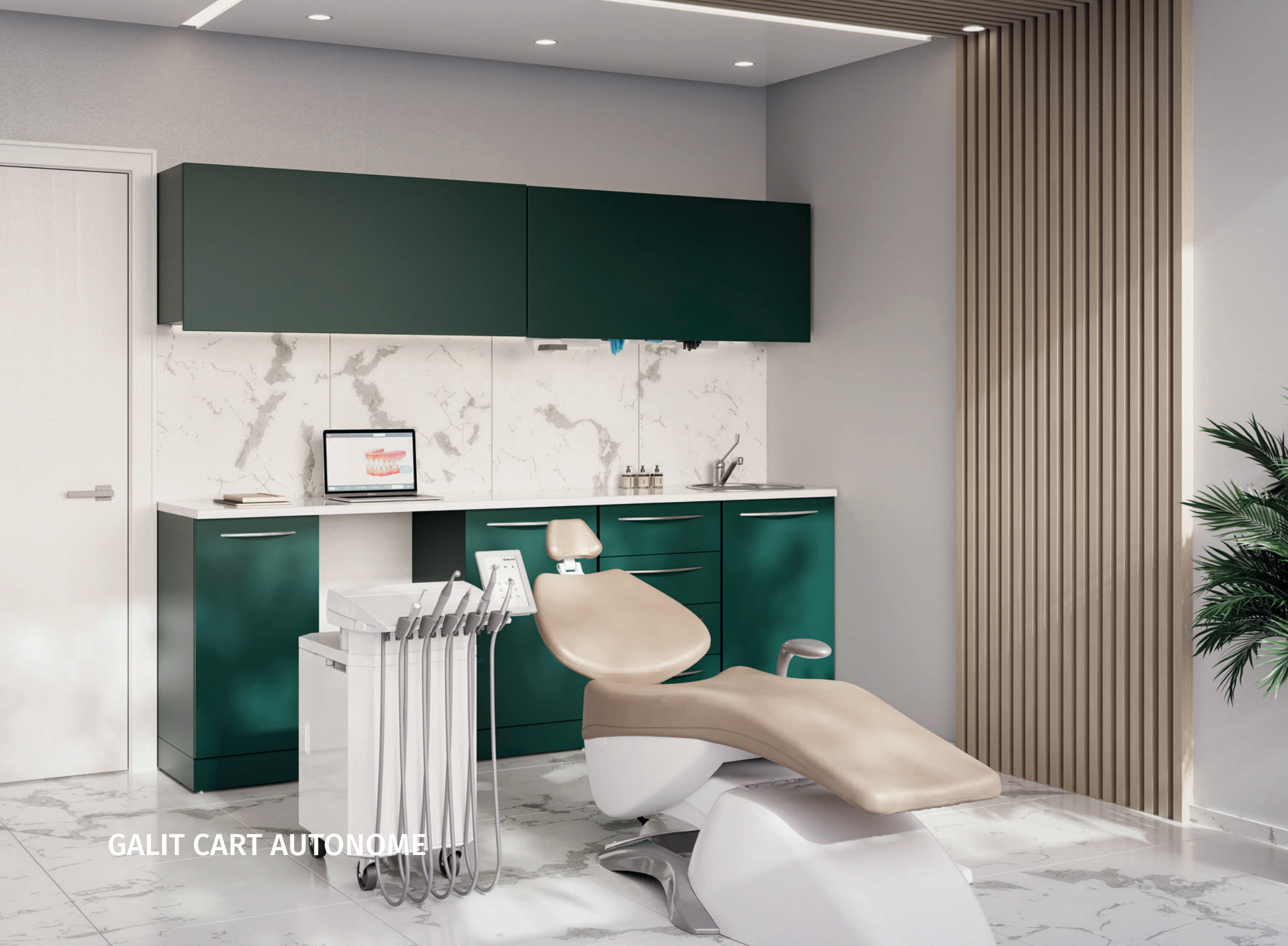
GALIT CART AUTONOME