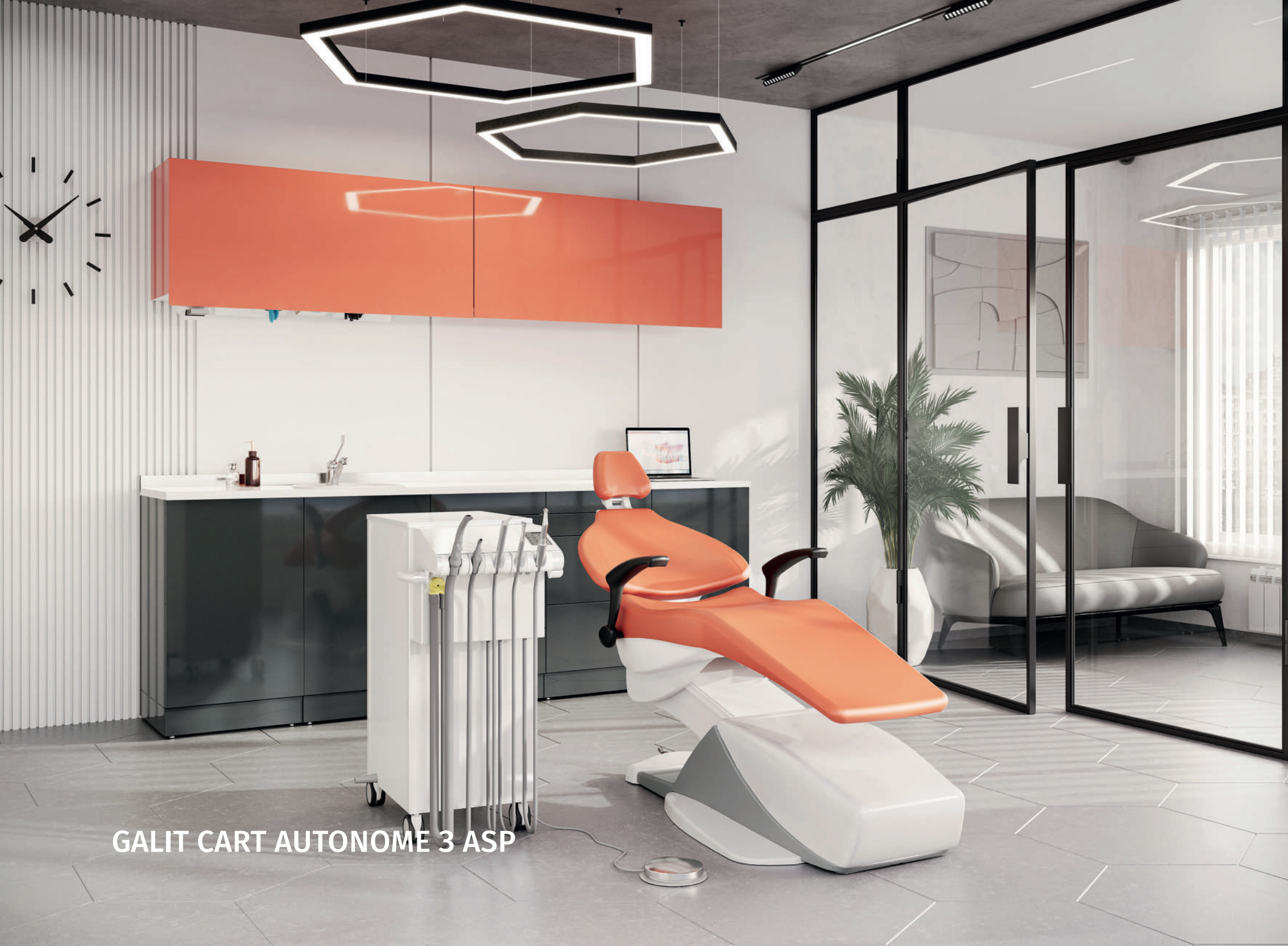
GALIT CART AUTONOME 3 ASP