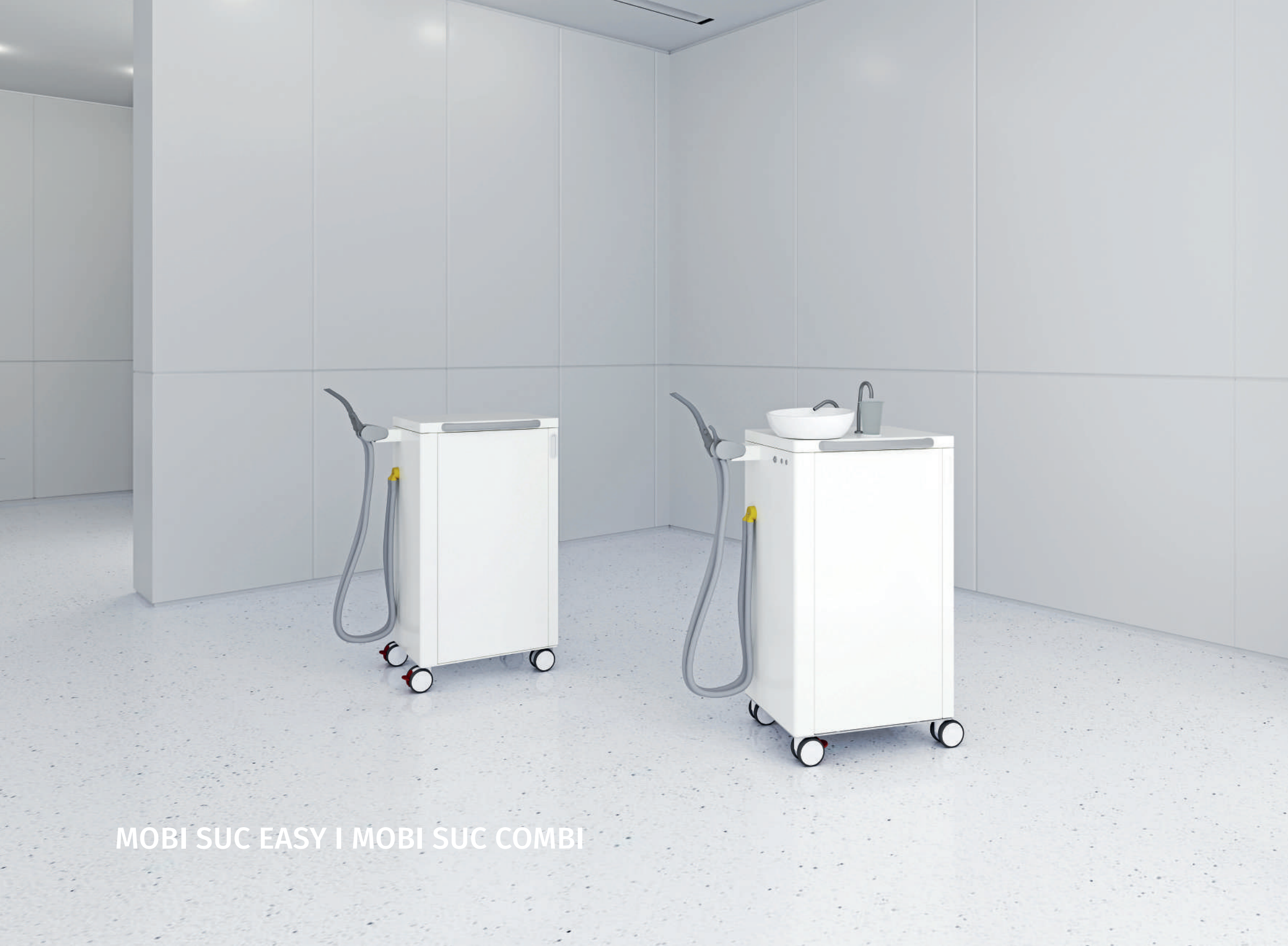
MOBI SUC EASY | MOBI SUC COMBI