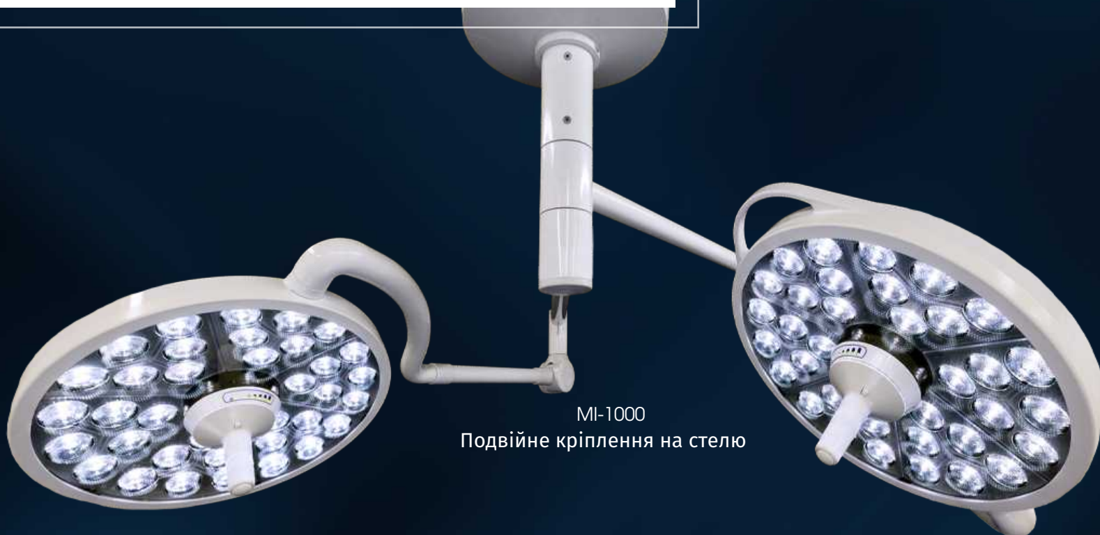
MI-1000 Подвійне кріплення на стелю