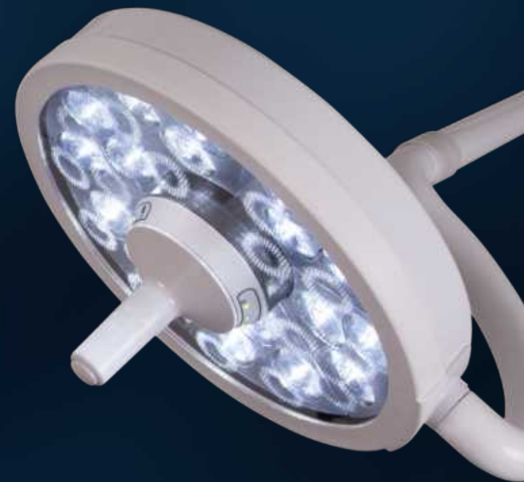
MI-750 Подвійне кріплення на стелю