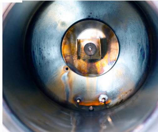
Без регулярного очищення камери