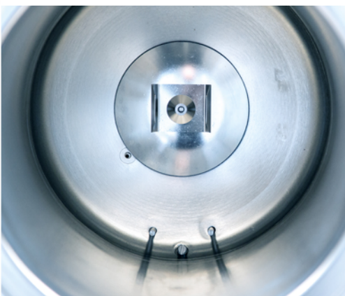
При регулярному використанні Chamber Protect