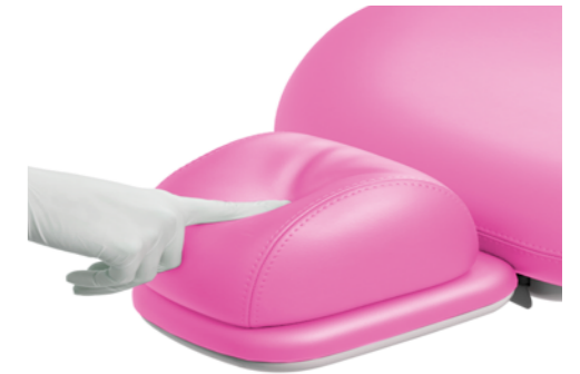
Обшивка Soft Foam

Також доступною для замовлення є обшивка крісла пацієнта Soft Foam.