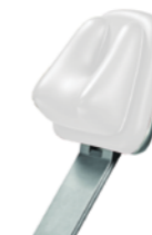
Elle E C2002 Bianco