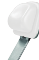
Elle E C95 Bianco